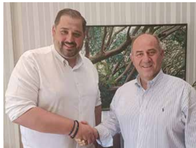
Λειτουργίας της τοπικής αυτοδιοίκησης. Του εύχομαι από καρδιάς δύναμη και επιτυχία», ανέφερε ο κ. Γερολιόλιος.

«Χαίρομαι να συμπορεύομαι με έναν νέο άνθρωπο, με τόσο έντονο ενδιαφέρον στα κοινά και τον τρόπο