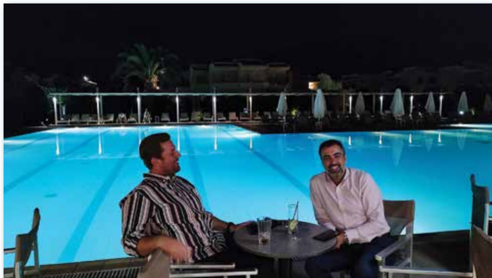
Η ΦΩΤΟΓΡΑΦΙΑ ΕΙΝΑΙ ΣΤΟ ΠΟΣΕΙΔΩΝ ΠΑΛΛΑΣ ΑΠΟ ΤΟ 1ο ΦΕΣΤΙΒΑΛ ΓΕΥΣΕΩΝ ΕΛΛΗΝΙΚΗΣ ΚΑΙ ΚΥΠΡΙΑΚΗΣ ΚΟΥΖΙΝΑΣ