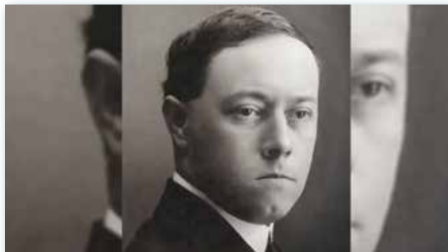
Ο μέγας δάσκαλος της λεγόμενης ελαφράς μουσικής