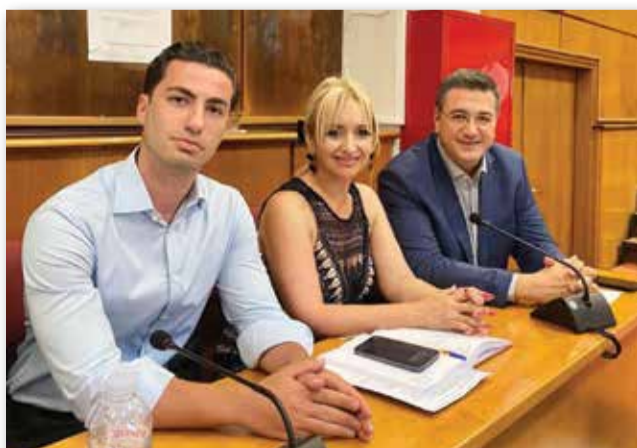
Ο Περιφερειάρχης Απόστολος Τζιτζικώστας, η Αντιπεριφερειάρχης Σοφία Μαυρίδου και ο Περιφερειακός Σύμβουλος Ηλίας Παπανικολάου