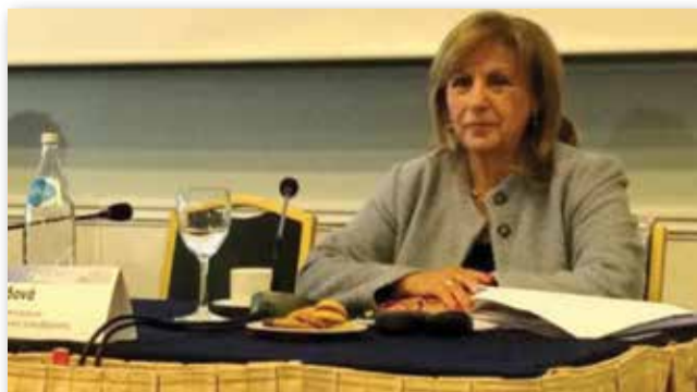
Αθηνά Αηδονά - Αθανασιάδου ΑΝΤΙΠΕΡΙΦΕΡΕΙΑΡΧΗΣ Οικονομικών και Προγραμματισμού - Αναπληρώτρια Περιφερειάρχης