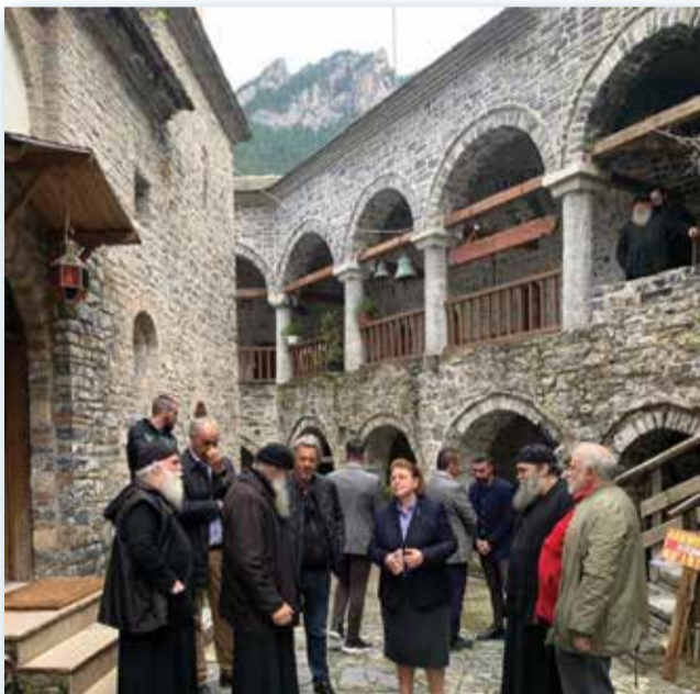
Η Υπουργός κ. Λίνα Μενδώνη κατά την επίσκεψή της στο μοναστήρι

Μόνο που κάποια στιγμή, σε όλο αυτό το εγχείρημα, υπήρξε μεγάλη δυσκολία στην πρόοδο των εργασιών καθώς δεν γνώριζαν πώς ενώνονταν οι δύο πτέρυγες αφού από τα εκρηκτικά είχαν καταστραφεί τελείως οι γωνίες και ήταν ανισόπεδες. Κι ενώ όλα έδειχναν πως η αναστήλωση «κολλάει», Γερμανός στρατιώτης που ήταν στην ομάδα αυτών που μετέφεραν τα εκρηκτικά για να ανατινάξουν το μοναστήρι, έστειλε μέσα σε φάκελο κάποιες φωτογραφίες. Λίγο πριν από την καταστροφή, είχε σηκώσει τη φωτογραφική μηχανή και αποτύπωσε το μέρος, όπως ακριβώς ήταν προτού διαλυθεί. Έτσι όπως αναστηλώθηκε σήμερα.