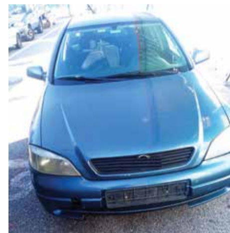
ΓΕΝΙΚΗ ΠΕΡΙΦΕΡΕΙΑΚΗ ΑΣΤΥΝΟΜΙΚΗ ΚΕΝΤΡΙΚΗ ΜΑΚΕΔΟΝΙΑΣ/ ΔΙΕΥΘΥΝΣΗ ΑΣΤΥΝΟΜΙΑΣ ΠΙΕΡΙΑΣ/ ΤΜΗΜΑ ΔΙΑΧΕΙΡΙΣΗΣ ΜΕΤΑΝΑΣΤΕΥΣΗΣ ΠΙΕΡΙΑΣ

Ο συλληφθείς με τη δικογραφία που σχηματίστηκε σε βάρος του θα οδηγηθεί στον Εισαγγελέα Πρωτοδικών Κατερίνης.