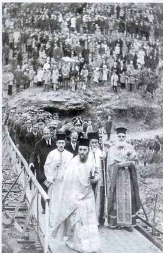
Θεοφάνεια στο Αιτόχωρο 1973