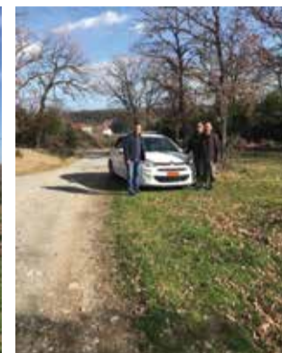
Αναστασιάδης, κάνοντας σχετική ανάρτηση στα κοινωνικά δίκτυα.