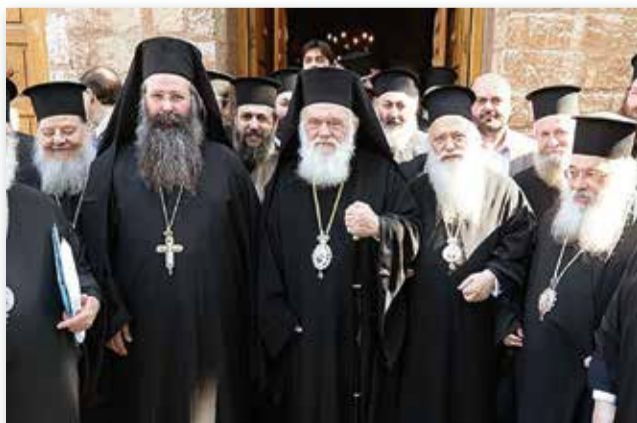
Φωτογραφία από την ημέρα εκλογής (2014) του Αρχιεπισκόπου Γεωργίου Χρυσόστομου στον θρόνο της Ιεράς Μητρόπολης Κίτρους, Κατερίνης και Πλαταμώνας