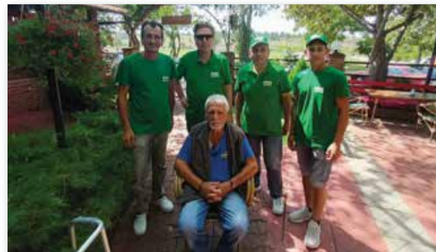
Με την ομάδα Τύρφης Ακτινιδίων