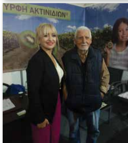
Με την Αντιπεριφερειάρχη Πιερίας Σοφία Μαυρίδου