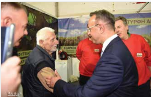
Με τον Χρήστο Σταϊκούρα