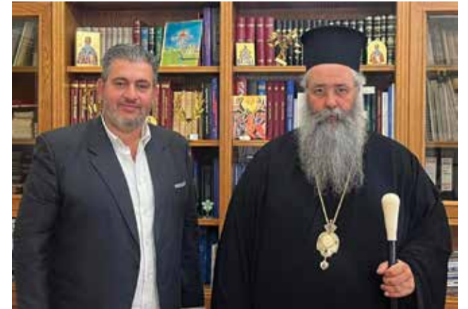
που παράγεται προς όφελος της τοπικής κοινωνίας, ο οποίος του ευχήθηκε καλή επιτυχία.

Ο υποψήφιος πρόεδρος του Επιμελητηρίου συνεχάρη τον Σεβασμιώτατο Μητροπολίτη για το έργο