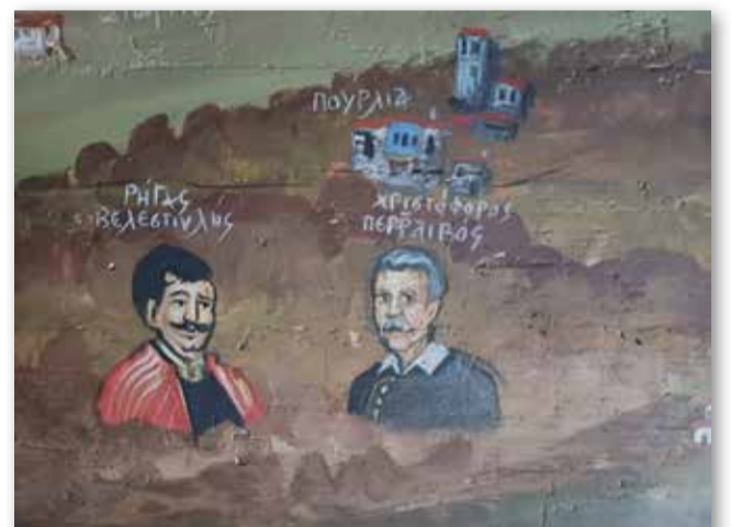
Ο Χριστόφορος Περραιβός και ο Ρήγας Βελεστινλής σε ξυλοαγογραφίες της Παναγίας του Ολύμπου που φιλοτέχνησε ο αιογράφος-εικαστικός Γιώργος Βροντινός (δωρεά της Ιωάννας Ν. Παπανικολάου στους Πολιτιστικούς Συλλόγους Νέων Πόρων και Σκοτίας)