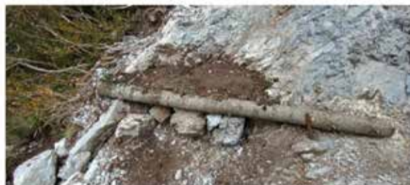
Εργασίες αποκατάστασης της βατότητας κατά θέσεις.

Επίσης μετά από ενέργειες της υπηρεσίας, εγκρίθηκαν 2 μελέτες που υποβλήθηκαν από την Πιερική Αναπτυξιακή Α.Ε. σε συνεργασία με τον Δήμο Δίου – Ολύμπου και την Υποδιεύθυνση Τεχνικών Έργων Π.Ε. Πιερίας,