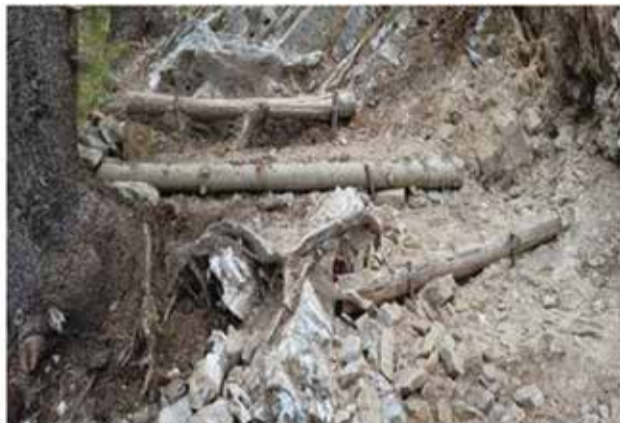
Καταστροφή του Ε4 κατά θέσεις λόγω της κακοκαιρίας Daniel.

Η Διεύθυνση Δασών Πιερίας μετά από αιτήματα πολιτών, ορειβατών και επισκεπτών του βουνού, προέβη κατά την διάρκεια της Μεγάλης Εβδομάδας, σε αποκατάσταση κατά θέσεις της βατότητας του μονοπατιού Ε4, από τα Πριόνια προς τα καταφύγια του Ολύμπου.