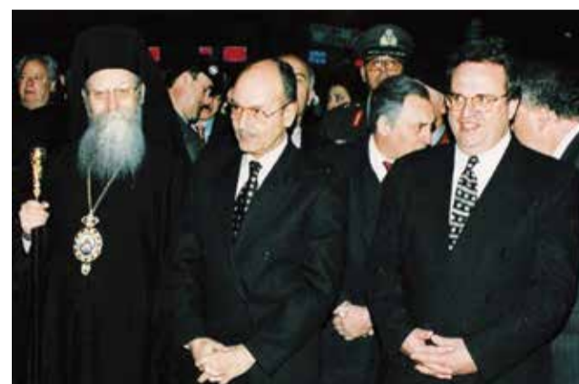
Σε ευχαριστούμε Γέροντα. Ο Θεός να σου χαρίσει τον Παράδεισο.

Η εποχή μας, και ιδιαίτέρως το έθνος μας, τούτη την κρίσιμη περίοδο, έχει ανάγκη προφητικών μορφών. Έχει ανάγκη ανθρώπων με προφητική διάθεση και προφητικό κήρυγμα.