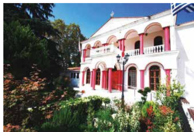
σαν, τον τίμησαν, τον φρόντισαν κατά την επίγεια ζωή του και τιμούν τη μνήμη του μετά την εκδημία του.