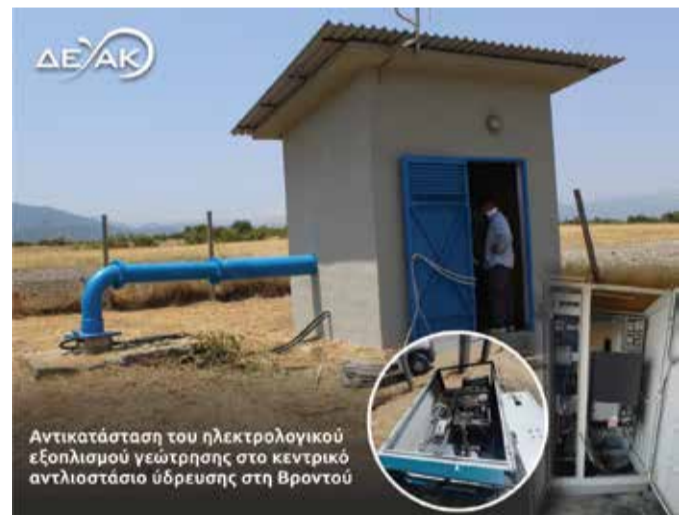
Αντικατάσταση του ηλεκτρολογικού εξοπλισμού γεώτρησης στο κεντρικό αντλιοστάσιο ύδρευσης στη Βροντού

Στην ίδια κατεύθυνση, η ΔΕΥΑΚ από τις αρχές το χρόνου εφαρμόζει ένα εντατικό πρόγραμμα ανακαίνισης, αναβάθμισης και συντήρησης όλων των υπο-