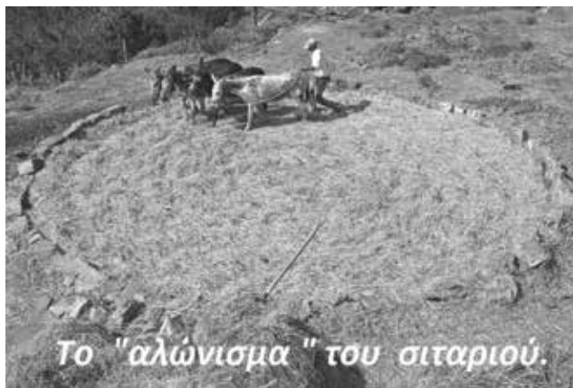
Το "αλώνισμα" του σιταριού.