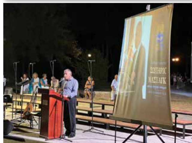
Δημοτική Χορωδία Λιτοχώρου «Ιωάννης & Θεόφραστος Σακελλαρίδης»