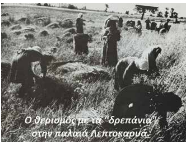
Ο θερισμός με τα "δρεπάνια" στην παλαιά Λεπτοκαρυά.