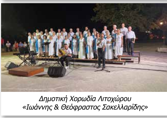
Δημοτική Χορωδία Λιτοχώρου «Ιωάννης & Θεόφραστος Σακελλαρίδης»