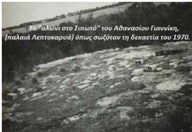
Το "αλώνι στο Σιπωτό" του Αθανασίου Γιαννίκη, (παλαιά Λεπτοκαρυά) όπως σωζόταν τη δεκαετία του 1970.