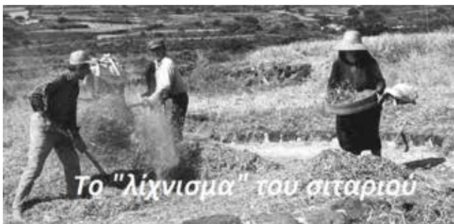
Το "λιχνισμα" του σιταριού