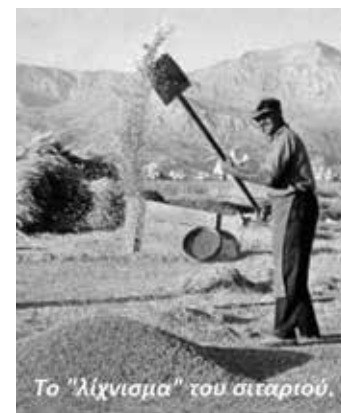
Το "λιχνισμα" του σιταριού.

Αρκετές πληροφορίες αντλήθηκαν από το βιβλίο του καθηγητή Γεωργίου Χατζή, «ΛΕΠΤΟΚΑΡΥΑ» και από το προσωπικό μου αρχείο.