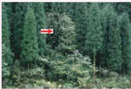
Fig. 15. Wild kiwifruit or actinoid. Actinidia chinensis var. deliciosa growing over trees in Sichuan, China.

Ήταν ή έρπον στο έδαφος σχηματίζοντας συμπαγής θάμνους ή αναρριχώμενα σε αιωνόβια δένδρα, φθάνοντας πολλές φορές τα 10 μέτρα σε ύψος.