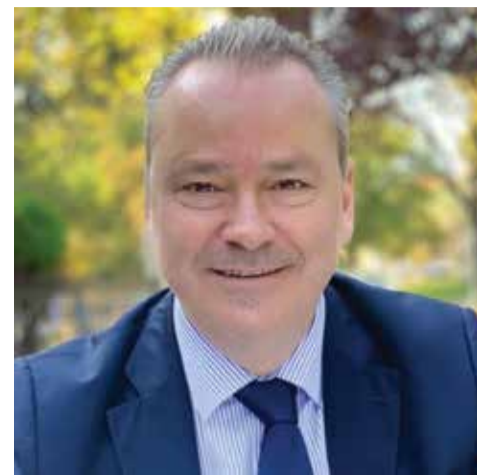
φους μου στο Δημοτικό Συμβούλιο καλή συνέχεια και επιτυχία στο έργο τους.

Εύχομαι στον Δήμο μας πρόοδο και ευημερία και σε όλους τους συναδέλ-