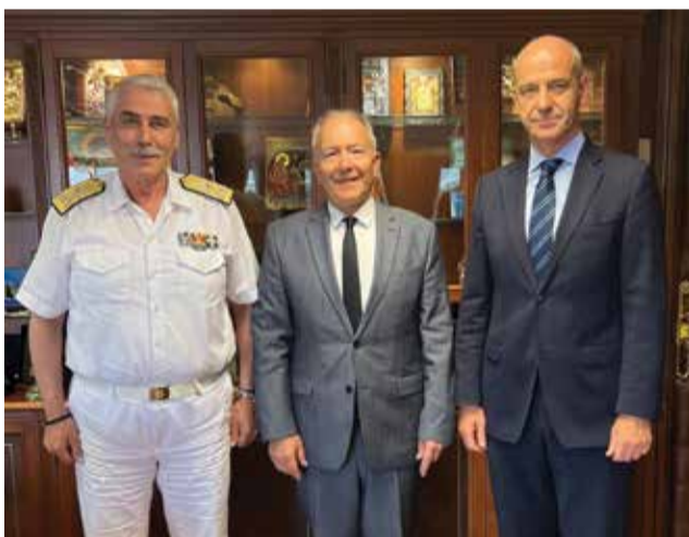
Πιερίας με νέα πλωτά και χερσαία μέσα για να καλυφθούν σημαντικές λειτουργικές ανάγκες για την κα-

Αντικείμενο της συζήτησης υπήρξε και η πρόοδος στη διαδικασία έκδοσης άδειας για το νέο κτίριο του Λιμενικού Ταμείου και του Λιμεναρχείου Σκάλας Κατερίνης στην Παραλία. Παράλληλα, ο κ. Μπαραλιάκος ζήτησε την άμεση ενίσχυση της Λιμενικής Αρχής