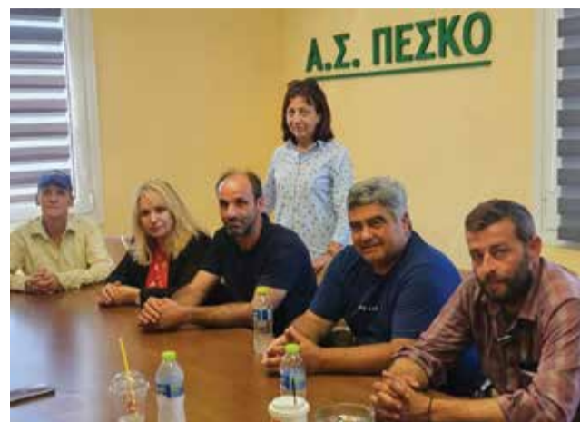
Ληθεί επισταμένως με τον ΕΛΓΑ.

Σημειώνεται πως στη συνάντηση που είχε η Υφυπουργός Ανάπτυξης και Βουλευτής Πιερίας με τους παραγωγούς της ΠΕΣΚΟ συζητήθηκαν και άλλα ζητήματα, όπως η καταβολή αποζημιώσεων από έκτακτα καιρικά φαινόμενα, ένα ζήτημα για το οποίο έχει ασχο-