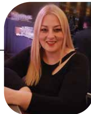
Με τη Σμαρώ Γιαννούλη

Στην περιοχή του Αγίου Σπυριδώνα βρέθηκαν την Κυριακή 10 Νοεμβρίου 2024, η Υφυπουργός Ανάπτυξης, Άννα Μάνη – Παπαδημητρίου, καθώς και η Αντιδήμαρχος Κατερίνης, Ελίνα Διαμαντοπούλου. Οι δύο σημαντικές κυρίες από την Πιερία είχαν την ευκαιρία να συναντηθούν και να συνομιλήσουν για αρκετό διάστημα, απολαμβάνοντας τον χρόνο τους μαζί. Δεν είναι γνωστό ακριβώς για ποια θέματα συζήτησαν, όμως είναι σίγουρο ότι η συζήτησή τους ήταν γόνιμη και ενδεχομένως επικεντρώθηκε σε ζητήματα που αφορούν την ανάπτυξη της περιοχής της Πιερίας, καθώς και τις προοπτικές που ανοίγονται για την τοπική κοινωνία και οικονομία. Είναι ενδιαφέρον να αναρωτηθούμε τι ακριβώς συζητούσαν κατά την συνάντησή τους.