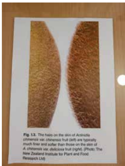
Fig. 1.3. The hairs on the skin of Actinidia chinensis var. chinensis fruit (left) are typically much finer and softer than those on the skin of A. chinensis var. deliciosa fruit (right).