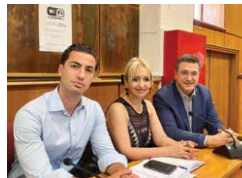
Περιφερειάρχης Απόστολος Τζιτζικώστας, Αντιπεριφερειάρχης Σοφία Μαυρίδου, Πρ. Περιφ. Σύμβουλος Ηλίας Παπανικολάου