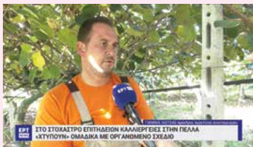
ΕΡΤ ΣΤΟ ΣΤΟΧΑΣΤΡΟ ΕΠΙΤΗΔΕΙΩΝ ΚΑΛΛΙΕΡΓΕΙΩΝ ΣΤΗΝ ΠΙΕΛΛΑ «ΧΤΥΠΟΥΝ» ΟΜΑΔΙΚΑ ΜΕ ΟΡΓΑΝΩΜΕΝΟ ΣΧΕΔΙΟ

Ένα απαράδεκτο και επαίσχυντο φαινόμενο παρατηρήθηκε τη φετινή σαιζόν συγκομιδής των ακτινιδίων σε διάφορες περιοχές της επικράτειας κι ελπίζω να μην «απλωθεί» στο μέλλον. Η κλοπή ακτινιδίων λόγω της υψηλής τιμολογιακής τιμής τους είναι ένα νέο φαινόμενο που σίγουρα απασχολεί τους παραγωγούς μας που λαμβάνουν μέτρα φύλαξης με τοποθέτηση καμερών ασφαλείας που είναι συνδεδεμένες μαζί τους και ειδοποιούν σε περίπτωση απόπειρας κλοπής.