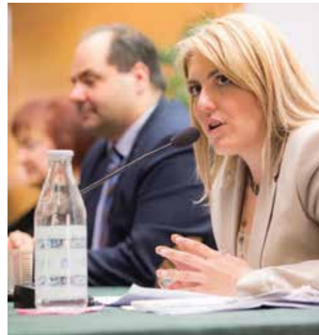
Αντιπεριφερειάρχης Μελίνα Δερμεντζοπούλου

Ήδη άρχισε η διαδικασία της διαδοχής του κ. Περιφερειάρχη με υποψήφιους τους Αντιπεριφερειάρχες Αθηνά Αηδονά, Κώστα Γιουτίκα, Μελίνα Δερμεντζοπούλου, Πάρη Μπίλια και Βούλα Πατουλίδου