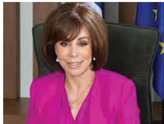
Αντιπεριφερειάρχης Βούλα Πατουλίδου