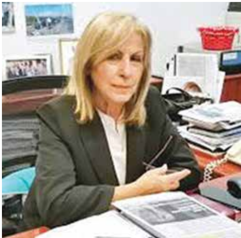
Αντιπεριφερειάρχης Αθηνά Αηδονά