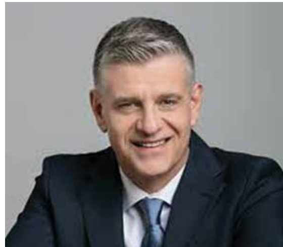
Αντιπεριφερειάρχης Κώστας Γιουτίκας