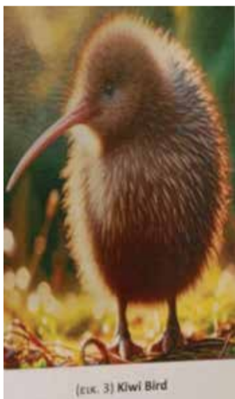
(εικ. 3) Kiwi Bird