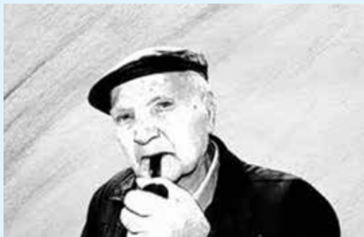
Φωτογραφία Νο 1

3 η θέση παγκοσμίως σε «παραγωγή» (1 η είναι η Κίνα και 2 η η Ν. Ζηλανδία).