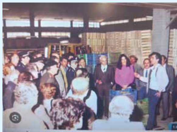
Φωτογραφία Νο 2