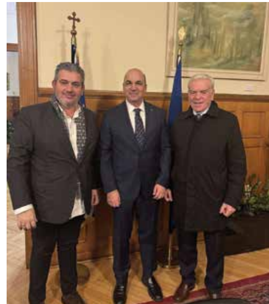
της προσφοράς του στον επιμελητηριακό θεσμό και στην επιχειρηματική κοινότητα.